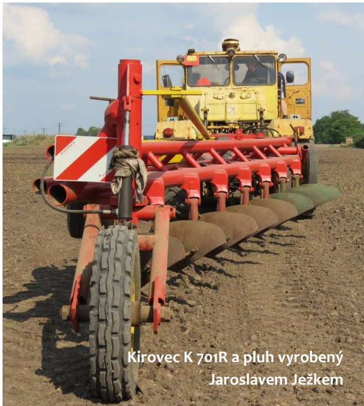
Kirovec K 701R a pluh vyrobený Jaroslavem Ježkem

Vytipovala jsem družstvo v Trnově, tam opravdu měli pluh podobný tomu, co jsem hledala.