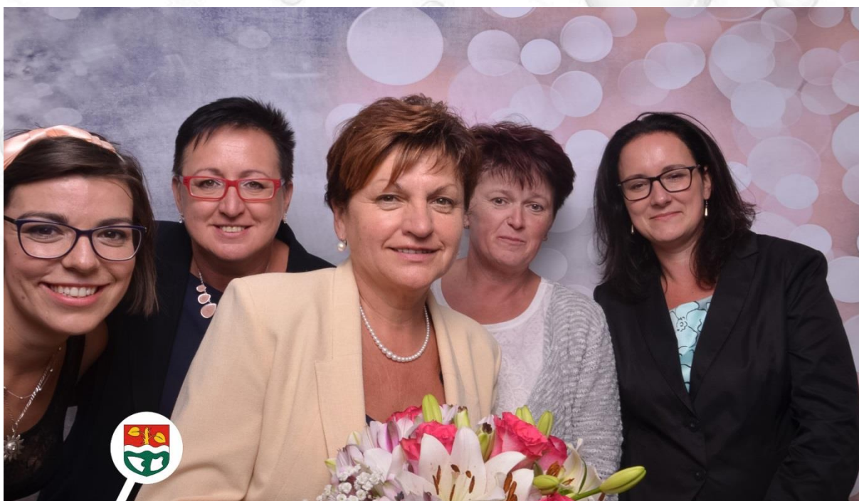
Slavnostní odhalení pamětní desky obětem 1. světové války, sraz rodáků a přátel obce