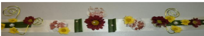
Soutěžní práce Karolíny

Soutěžící vytvořili uvítací kytici k uctění královny Isis a květinový šperk pro královnu Isis, vše z dodaného materiálu a květin.