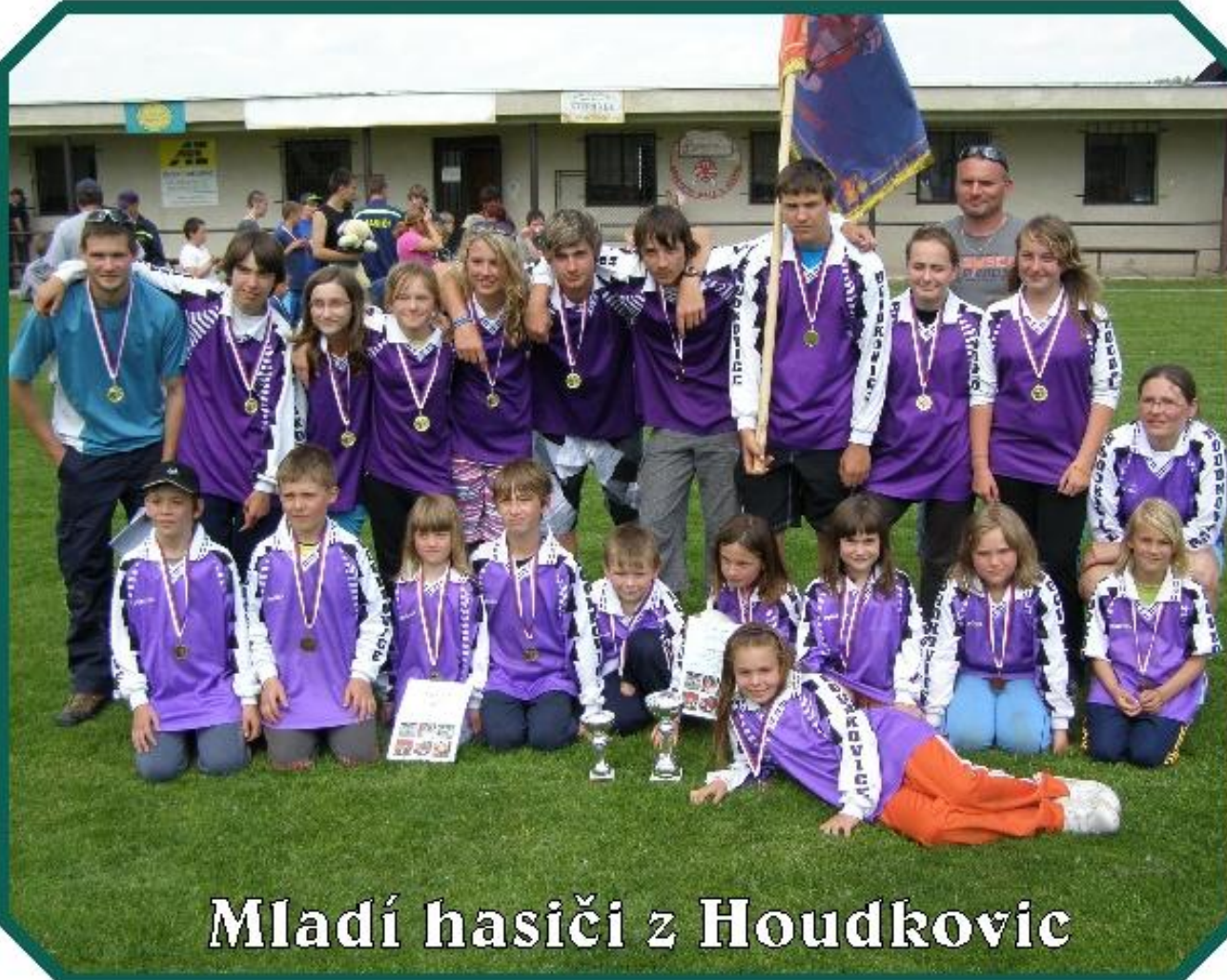
Mladí hasiči z Houdkovic