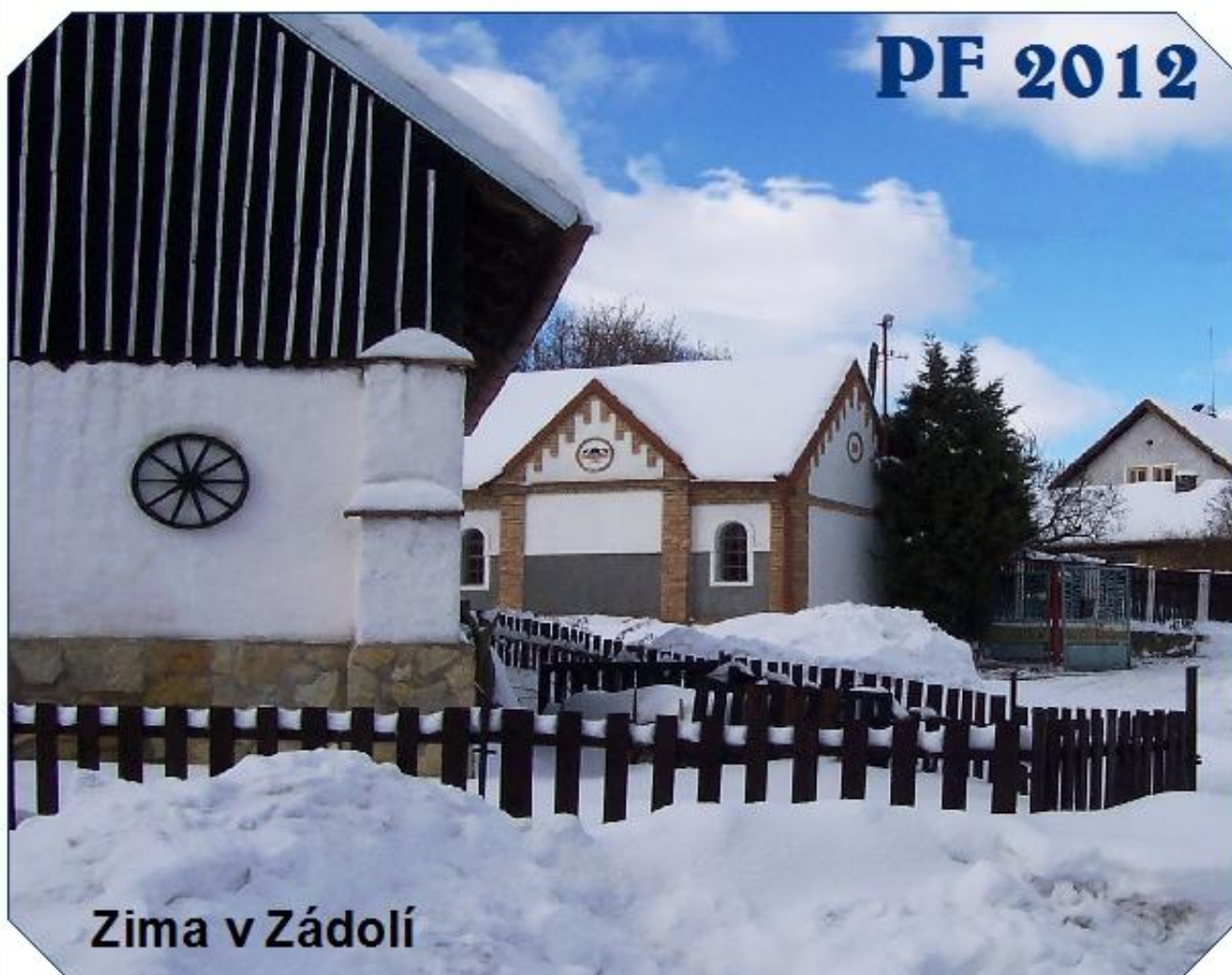
Zima v Zádolí