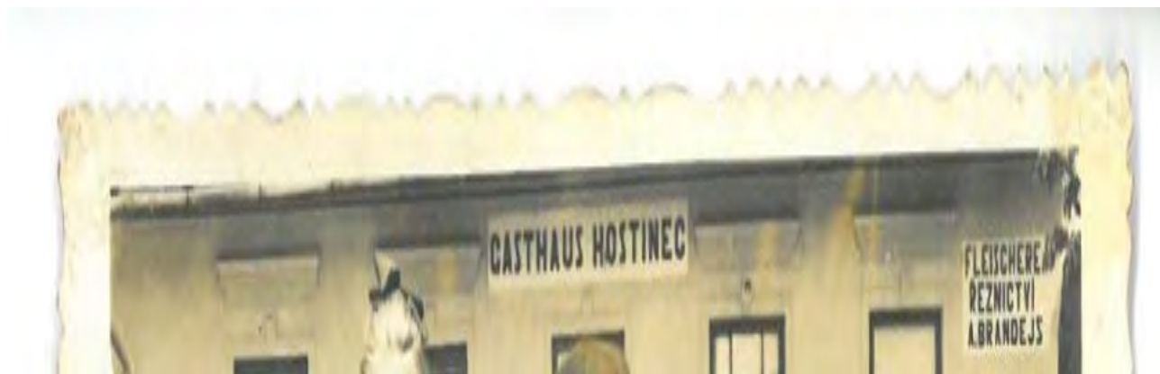
Budova Hostince U Brandejsů v době zřízení VTS 1943