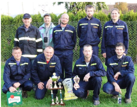
Startovní a výsledková listina 1. kolo soutěže požárních družstev – okrsek č. 11 Trnovsko, 20.5.2016 Houdkovice