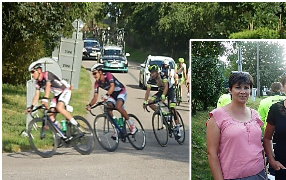
Fotografie ze Záhornice.

Cyklistické závody East Bohemia Tour zařazené do kalendáře světového poháru mezinárodní cyklistické unie UCI a amatérský silniční Hobby maraton Grand Prix Královéhradeckého kraje vedly skrz naše obce a to v sobotu 10. září 2016.