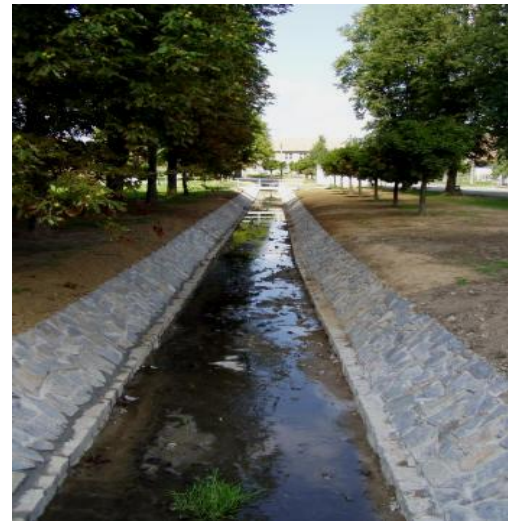
Oprava regulovaného potoka Trnov