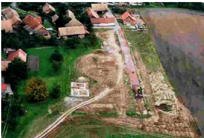
Rozhledna Osičina a vysílač T-mobile

– největší investiční akce v historii Obce Trnov