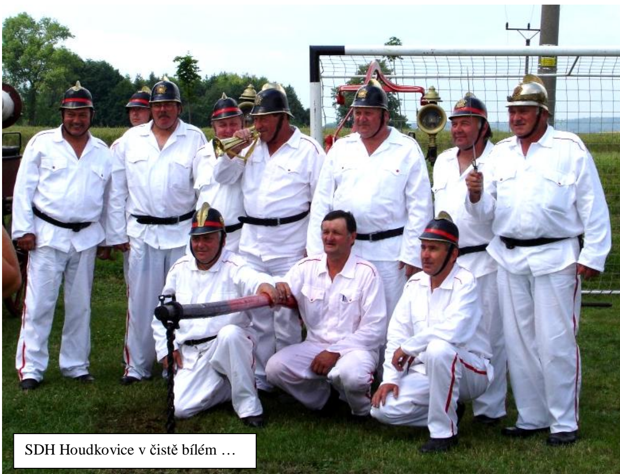
SDH Houdkovice v čistě bílém ...

Na závěr prázdnin uspořádali v Houdkovicích pro děti „Pohádkový les“. Pohádkové bytosti neměly chybu.